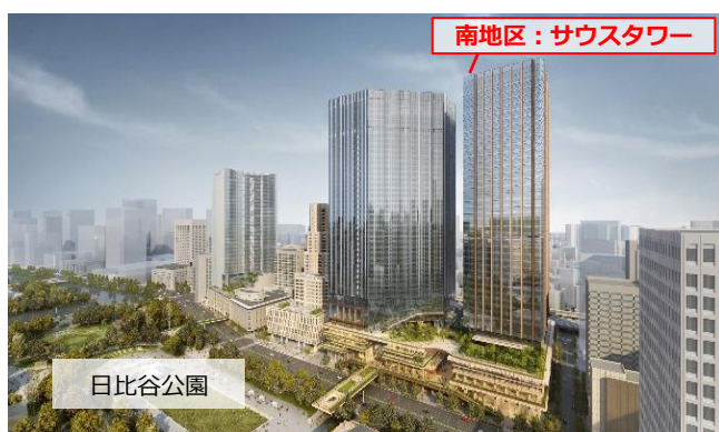
▲内幸町一丁目街区完成イメージ

本事業は、「(仮称)内幸町一丁目街区開発プロジェクト」の事業構想として本年3月に発表した「TOKYO CROSS PARK構想」のうち、「南地区」(サウスタワー等)にかかる再開発事業です。街区全体は北地区・中地区・南地区で構成され、約16haの日比谷公園とつながるとともに、都心最大級の延床面積約110万㎡を開発します。本事業(南地区)では、オフィスや商業施設、ホテル、ウェルネス促進施設を備え、比類なき街づくりの一翼を担う予定です。